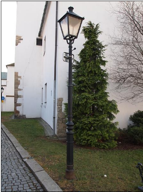
Stávající lampa venkovního osvětlení, u vstupu bude doplněn jeden kus