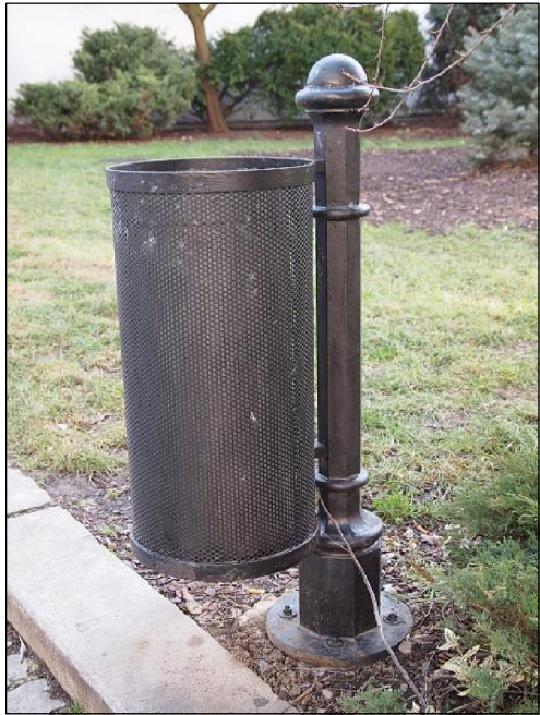
Stávající odpadkový koš