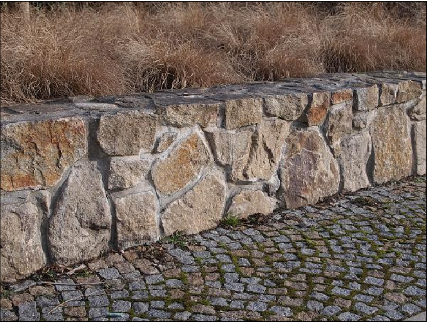
Betonová zídka s obkladem z přírodního kamene (viz. nová tržnice)