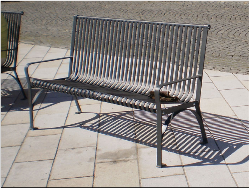
Kovová lavička ATHENA KARIM - 6ks (stejný typ, jaký je použit na Masarykově náměstí)