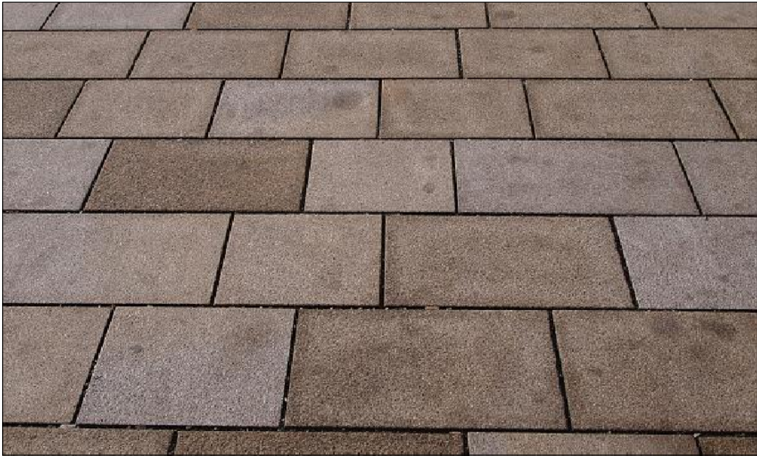
Žulová dlažba - rozměry cca 40x40 až 40x60cm (stejný typ, jaký je použit na Masarykově náměstí nebo u nové tržnice)